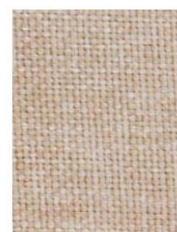
Cod. 00BE BEIGE