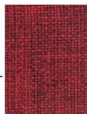
Cod. 00RO ROSSO