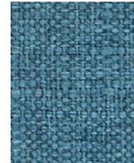
Cod. 00AZ AZZURRO